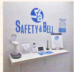
インターホンは設置後15年程度で交換が必要。今後も成長が見込める分野